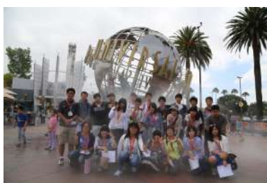
ユニバーサルスタジオ