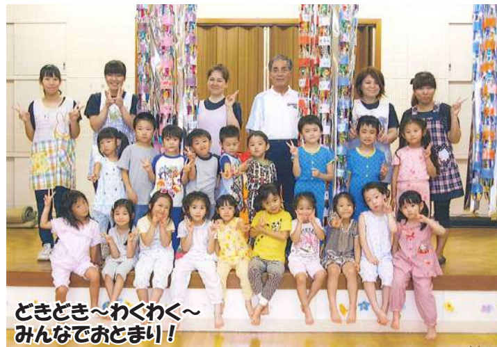
ときどき～わくわく～ みんなでおとまり!

スタートは相生町にある大善寺での「おっとめ」。理事長先生の法話に緊張感もほぐれ、子どもたちは自信を胸に幼稚園に戻りました。そして、スイカ割り、夕食（カレーライス）・キャンプファイヤーと続き、最後の花火大会まで計画通り実施できました。子どもたちは、一つ一つのプログラムに感激