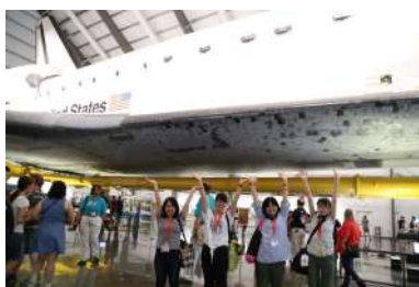
カリフォルニアサイエンスセンターに展示されている、スペースシャトル・エンデバー号