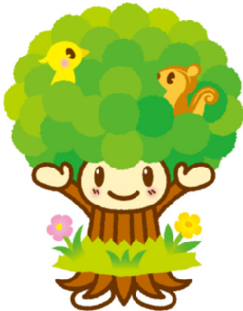
樹徳キャラクター 「ピッパ」